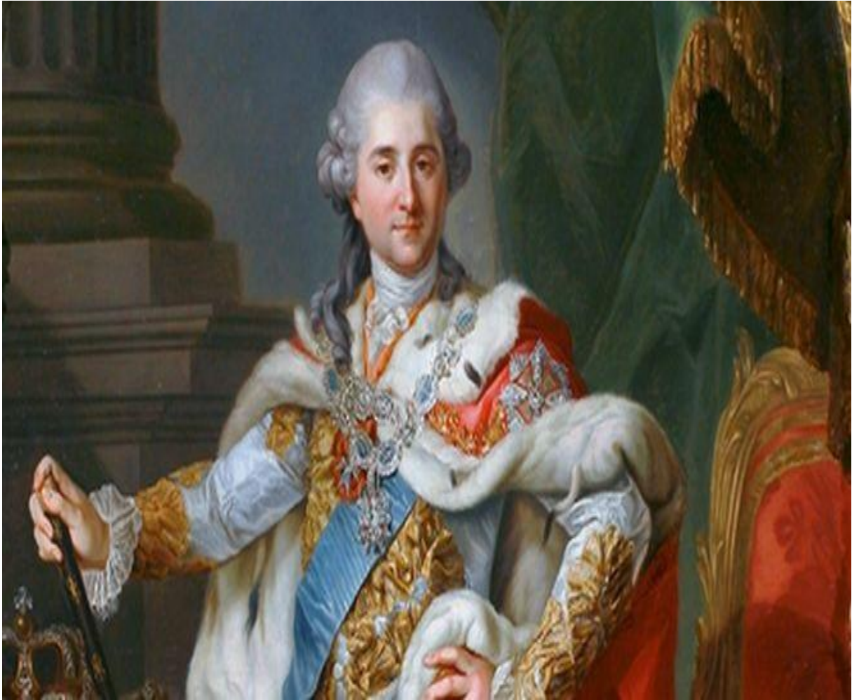
STANISŁAW AUGUST PONIATOWSKI